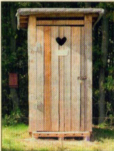
Der Ort für Hornissen-Geschäfte.

Zwar war damit auch die Bestimmung des stillen Örtchen dahin, allerdings war es für Rubel „wunderbar zuzuschauen, wie nach und nach das Nest gebaut wurde, wie die Population der Hornissen zunahm. Sie konnten nun den ganzen Sommer über ihrer Brut ungestört nachgehen und stehen nun kurz vor dem Ende ihres Daseins. Die Larven, die nicht mehr gefüttert wurden, sind aus dem Nest herausgefallen und liegen auf der Sitzbank. Ebenso können wir feststellen, dass der Beflug in den letzten Wochen und Tagen immer mehr nachgelassen hat. Inzwischen